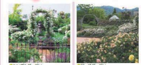
シンボルガーデン イギリスの一般的な家庭の庭園を再現。四季折々の変化を楽しんでいただけます。 ローズガーデン 香りが特に豊かなことで知られるオールドローズを中心に、約700株のバラを立体的に植栽しています。