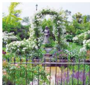
●シンボルガーデン イギリスの一般的な家庭の庭園を再現。四季折々の変化を楽しんでいただけます。