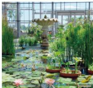
●インドアガーデン 庭園の象徴となっている大きなガラスハウスで、色鮮やかな亜熱帯の植物をご覧いただけます。