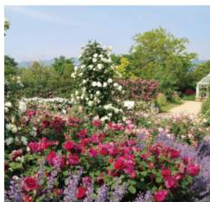
●ローズガーデン イングリッシュローズを中心に植栽された約500株のバラは、5月中旬～下旬に最も華やかな季節を迎えます。