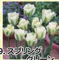
9. スプリンググリーン