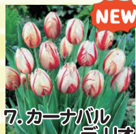
17. カーナバルデリオ