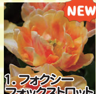
11. フォクシーフォックストロット