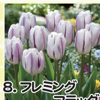
18. フレミングフラッグ