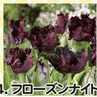
4. フローズンナイト