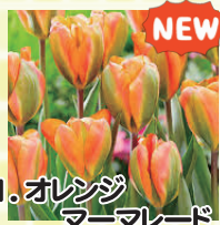
1. オレンジマーマレード