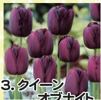
13. クイーンオブナイト