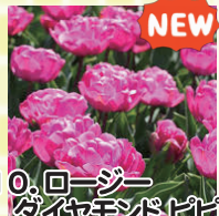
10. ロージーダイヤモンドピピ