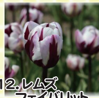
12. レムズフェイバリット