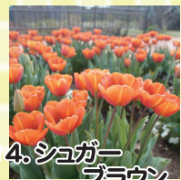
14. ショガーブラウン