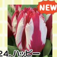
24. ハッピークラウン