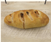
いちじく&クリームチーズ 320円