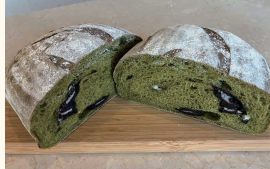
伊勢茶(緑茶)カンパーニュ